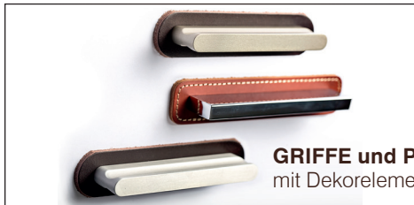
GRIFFE und PROFILE – mit Dekorelement aus Leder