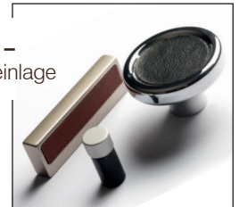
KNÖPFE – mit Ledereinlage