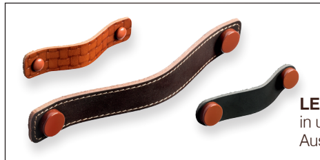
LEDERLASCHEN – in unterschiedlichsten Ausführungen